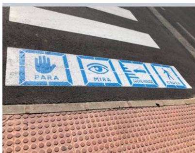
Imagen a modo de ejemplo de la adaptación de un paso para peatones, en relación con la educación vial, realizada por el Ayuntamiento de Pinoso.

Otras entidades locales de la provincia, como por ejemplo Pinoso, ya se hacen eco de estas medidas, que innegablemente redundan en beneficio de las personas con autismo, y de sus familias.